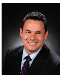
Jeff Casper Alcalde Temporal, Lugar 2