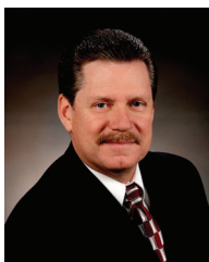
Stan Pickett Alcalde

Versión en español en www.cityofmesquite.com/MainstreamEspanol