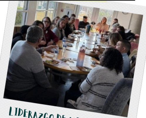
LIDERAZGO DE MESQUITE

Los residentes de Mesquite están aceptando el reto de participar. Eso significa que están comprometidos a participar activamente en todo lo relacionado con Mesquite: voluntariado para ayudar a los vecinos necesitados, asistir a los eventos de la ciudad, a las reuniones del Concejo Municipal y más. Estas son algunas maneras en las que la gente ha dado el paso al frente para involucrarse en la comunidad. Cuando nos conectamos y trabajamos juntos por un objetivo común, Mesquite -y todos- nos hacemos más fuertes.