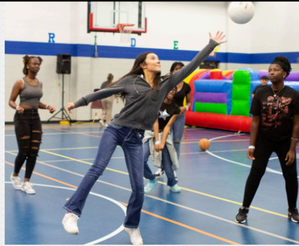
EVENTOS TEEN TURNOUT