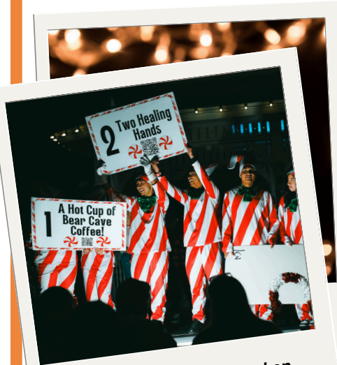
“Doce días de Navidad en Downtown Mesquite”

Mesquite celebró unas fiestas inolvidables. Residentes y visitantes disfrutaron de una variedad de eventos festivos, como parte del 2024 Real. Texas. Holidays. , que empezaron con Navidad en la Plaza, el 3 de diciembre.