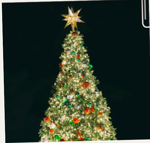
Iluminación del árbol de Navidad comunitario