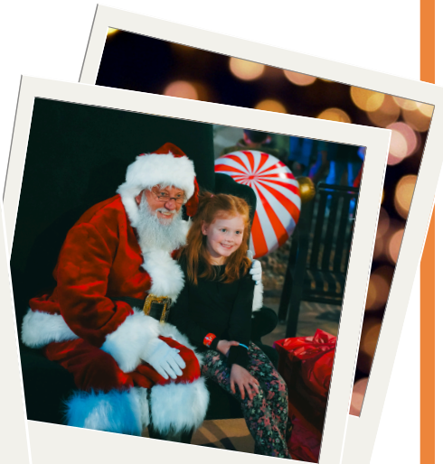
Fotos con Santa