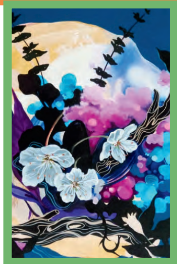
“Cocoon Blossom” por Patricia Rodriguez

Vea más eventos del Mes de la Herencia Hispana, en www.cityofmesquite.com/HHM .