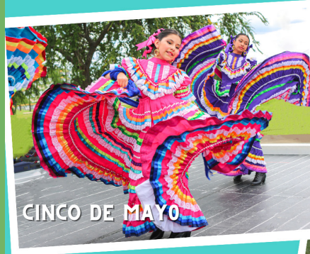
CINCO DE MAYO