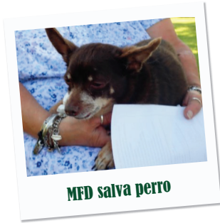
MFD salva perro

Reactivación económica de Mesquite: los empleados del Departamento de Financiamiento de la Ciudad de Mesquite donaron alimentos no perecederos y dinero para ayudar a las organizaciones Mesquite Social Services y Sharing Life Community Outreach en Mesquite durante la pandemia por COVID-19.