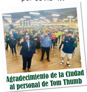
Agradecimiento de la Ciudad al personal de Tom Thumb

MFD salva perro: en junio, el Departamento de Bomberos de Mesquite (MFD) rescató a un perro de un incendio residencial. Los bomberos pudieron reanimar a la mascota y reunirla con sus dueños.