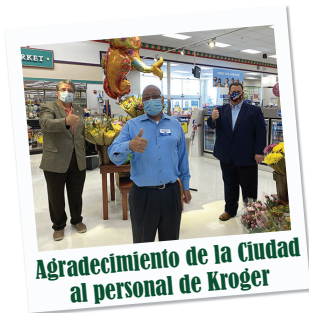
Agradecimiento de la Ciudad al personal de Kroger