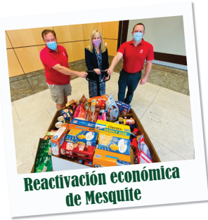
Reactivación económica de Mesquite

Reactivación económica de Mesquite: los empleados del Departamento de Financiamiento de la Ciudad de Mesquite donaron alimentos no perecederos y dinero para ayudar a las organizaciones Mesquite Social Services y Sharing Life Community Outreach en Mesquite durante la pandemia por COVID-19.