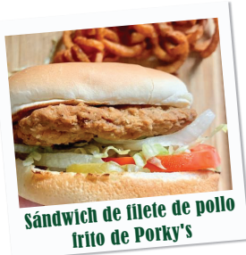
Sándwich de filete de pollo frito de Porky's

El 30 de mayo, la ciudad inició su campaña Reactivación de Mesquite, a medida que la comunidad pasa del estado de crisis a la fase de reactivación en respuesta a la pandemia por el COVID-19, con la cual recaudó 587 libras de alimentos y 1,351 dólares que se distribuirán entre las organizaciones Sharing Life Community Outreach y Mesquite Social Services.