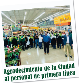
Agradecimiento de la Ciudad al personal de primera línea

El personal de la Ciudad se reunió con representantes de la NAACP Tri East de Mesquite TX. El objetivo de la reunión era abrir el diálogo para ayudar a mejorar la igualdad racial en la comunidad.