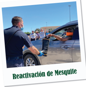
Reactivación de Mesquite