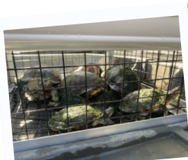
Vida silvestre de lago Palos Verdes

Empleados municipales fueron honrados durante la Semana Nacional de Obras Públicas. Estos premios anuales brindan reconocimiento en cada división de Obras Públicas a los empleados y supervisores que exhiben un alto rendimiento.