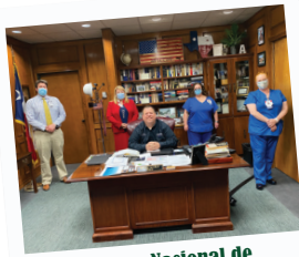
Semana Nacional de los Hospitales

La Ciudad de Mesquite celebra el quinto aniversario de un programa de mariscales en su Tribunal Municipal.