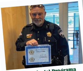
Aniversario del Programa de Mariscales