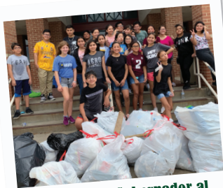
Premios del Gobernador al Logro Comunitario

Campaña Spread the Love El 2 de abril, en honor al Día Nacional de la Mantequilla de Maní y Mermelada, el club AMBUCS donó $1,000 a la Campaña de Recolección de Alimentos Spread the Love, que brinda apoyo a los Servicios Sociales de Mesquite y Sharing Life Community Outreach.