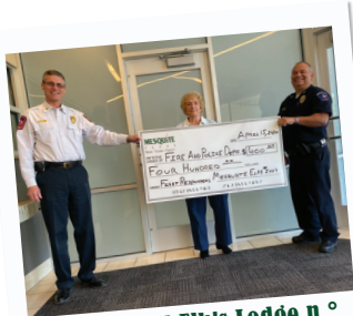
Fraternidad Elk's Lodge n.º 2404 y Damas Auxiliares Elk

Premios del Gobernador al Logro Comunitario: El programa Keep Texas Beautiful otorgó a Mesquite el 2.º lugar del Premio del Gobernador al Logro Comunitario por sus esfuerzos en mantener la comunidad atractiva y consciente del medio ambiente.