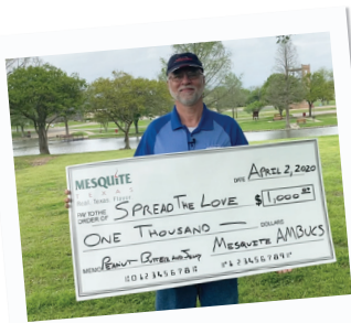
Campaña Spread the Love

Campaña Spread the Love El 2 de abril, en honor al Día Nacional de la Mantequilla de Maní y Mermelada, el club AMBUCS donó $1,000 a la Campaña de Recolección de Alimentos Spread the Love, que brinda apoyo a los Servicios Sociales de Mesquite y Sharing Life Community Outreach.