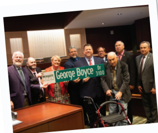
Calle George Boyce Drive

El 1 de febrero, el Departamento de Policía de Mesquite llevó la carga para ayudar a recaudar más de $ 22,000 dólares a beneficio de las Olimpiadas Especiales de Texas en el evento anual Zambullida Polar.