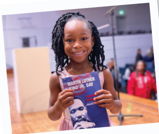
Celebración de MLK, Jr.

El 6 de enero, Mesquite ISD donó más de $ 1,000 al Monumento Conmemorativo a los Veteranos de Guerra de Mesquite. El monumento honrará a los veteranos militares, sus familias y aquellos que ofrendaron sus vidas al servicio de nuestro país.