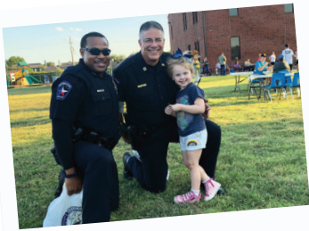
Noche Nacional Contra el Crimen

El 1 de octubre, varios vecindarios de Mesquite organizaron eventos y actividades durante la Noche Nacional contra el Crimen para fomentar zonas residenciales más seguras y un sentido de comunidad más sólido.