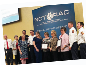
Premio Comunidad Heart Safe

El 2 de octubre, el Departamento de Policía de Mesquite organizó eventos "Un cafecito con un policía" en McDonald's locales para participar y comunicarse con los ciudadanos sobre temas de seguridad pública en la comunidad.