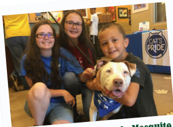
Albergue de Animales de Mesquite (MAS)

El 17 de agosto, el albergue de Animales de Mesquite (MAS, sigla en inglés) organizó el evento Desocupar el Albergue de 2019, mediante el que nuevas familias adoptaron 89 animales. Durante el evento anual no se cobra la cuota de adopción por todo un día. MAS también celebró recientemente veinticuatro meses consecutivos con una tasa de rescate de más del 90 por ciento de todos sus animales.