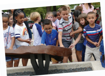
Evento conmemorativo en Freedom Park

La Oficina de Turismo y Convenciones de Mesquite (CVB, sigla en inglés) recibió cinco premios en la reciente Conferencia Anual de la Asociación de Turismo y Convenciones de Texas por su excelencia en la promoción de destinos. Los premios incluyeron el premio People's Choice Awards por el volumen presupuestario en las categorías de Publicidad, Sitio web, Sitio móvil y Video.