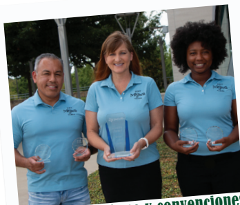
Oficina de turismo y convenciones de Mesquite (CVB)

El 17 de agosto, el albergue de Animales de Mesquite (MAS, sigla en inglés) organizó el evento Desocupar el Albergue de 2019, mediante el que nuevas familias adoptaron 89 animales. Durante el evento anual no se cobra la cuota de adopción por todo un día. MAS también celebró recientemente veinticuatro meses consecutivos con una tasa de rescate de más del 90 por ciento de todos sus animales.