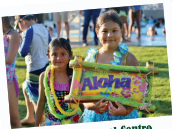
Fiesta Luau en el Centro Acuático City Lake