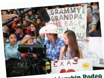
Mesquite Championship Rodeo con Good Morning America