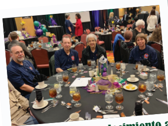
Almuerzo de agradecimiento a los voluntarios

La Ciudad celebró el almuerzo anual de agradecimiento a los voluntarios para expresar su gratitud a los ciudadanos voluntarios por donar su tiempo y habilidades en 2018. Más de 800 voluntarios donaron 51,000 horas o más a varios programas y servicios de la Ciudad