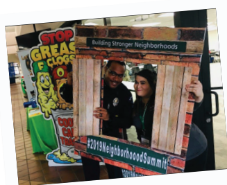
Cumbre Vecinal de 2019

La Ciudad celebró el almuerzo anual de agradecimiento a los voluntarios para expresar su gratitud a los ciudadanos voluntarios por donar su tiempo y habilidades en 2018. Más de 800 voluntarios donaron 51,000 horas o más a varios programas y servicios de la Ciudad