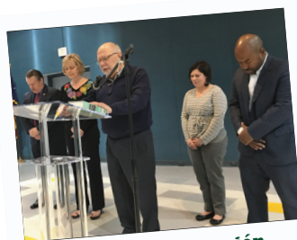
Desayuno de oración del alcalde