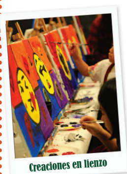
Creaciones en lienzo

Exhibición de Texas Area Artists , del 4 al 29 de marzo, de lunes a viernes, de 8 a. m. a 5 p. m., en las galerías Main y Chamber. Este evento es gratis