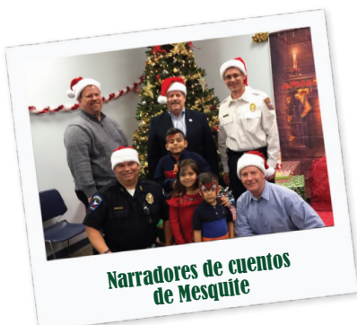
Narradores de cuentos de Mesquite