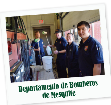
Departamento de Bomberos de Mesquite

En diciembre, Petco Distribution Warehouse donó 24,000 libras de comida para perros, comida para cachorros y arena sanitaria para gatos a los Servicios de Animales de Mesquite.