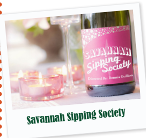
Savannah Sipping Society