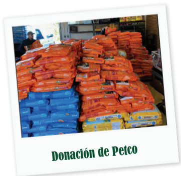
Donación de Petco

La Orquesta Sinfónica de Mesquite interpretará Carnival el 23 de marzo, a las 6:30 p. m. Los boletos están a la venta en www.mesquitesymphony.org . Para adquirir entradas visite www.mesquitecommunitytheatre.org