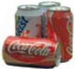
Latas de aluminio