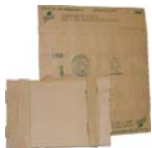
Cartón (aplantar y colocar en el fondo del contenedor)