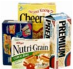
Cartoncillo (como cajas de cereal o galletas)