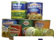
Latas de acero y latón (enjuagar y dejar las etiquetas)